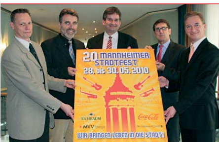
Jubiläumsauflage: Das 20. Stadtfest wird neue Maßstäbe setzen.