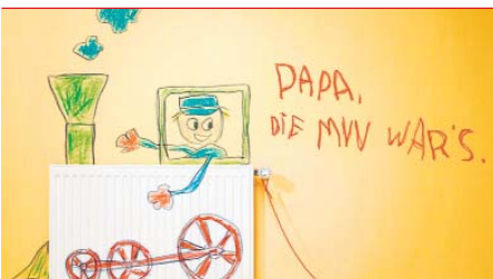
Holte den ersten Platz bei der MM-Anzeigenprämierung für 2009: die Anzeige der MVV.