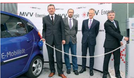
Gemeinsam erfolgreich: MVV Energie, m:con und engelhorn ziehen an einem Strang.