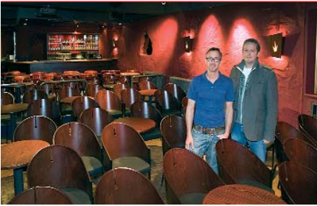
Auf Vordermann gebracht: Das Schatzkistl geht mit frischem Glanz in die Saison.

Die Renovierungsarbeiten im Musik-Kabarett Schatzkistl sind abgeschlossen