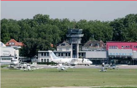
Der Mannheimer City Airport galt als Tagungsstätte des Gremiums bei seinem jüngsten Treffen.