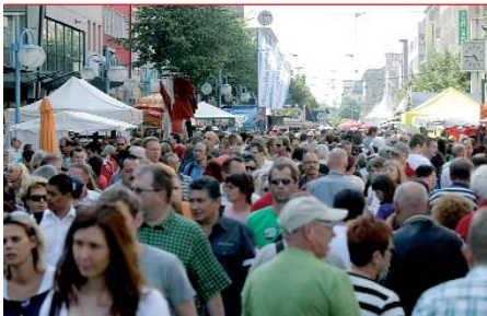
Das Mannheimer Stadtfest findet vom 28. bis 30. Mai auf den Planken statt.