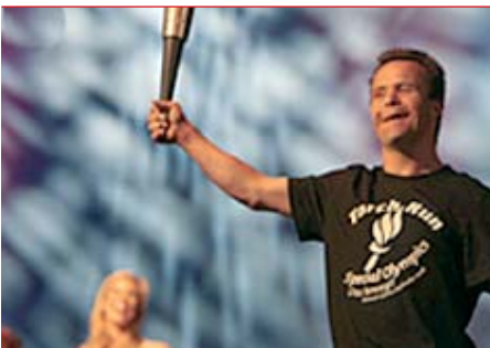
ABB bereichert das Mannheimer Stadtfest mit einem Fackellauf.