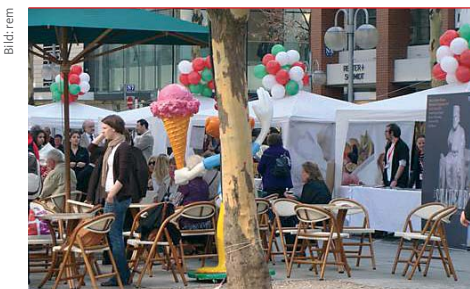
Italienisches Flair herrschte auf den Kapuzinerplanken beim „2. Europäischen Tag des handgemachten Speiseeises“.