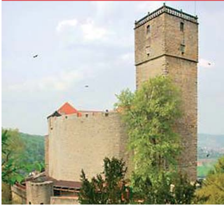
Die Burg Guttenberg war nur eine der vielen Stationen, die eine Journalistengruppe besuchte.