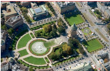
Bei den neuen Touren durch Mannheim können Touristen die schönsten Seiten der Quadratesstadt entdecken.