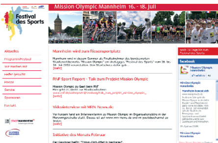
Die neue Homepage ist online.