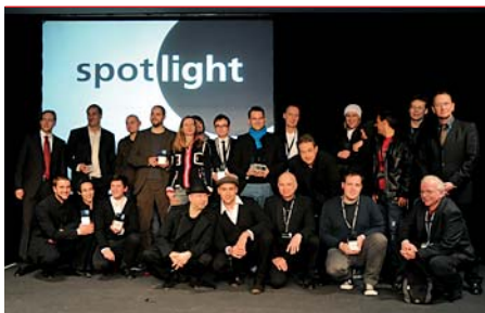
So sehen kreative Köpfe aus: Die Gewinner des Vorjahres beim Gruppenfoto.