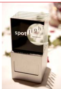
Objekt der Begierde: der spotlight-Award.