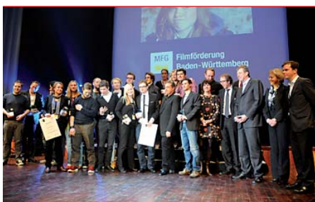
Die Sieger des Publikumsawards.

Stadtmarketing kooperiert mit spotlight-Festival und lobt Mannheim-Award 2012 aus