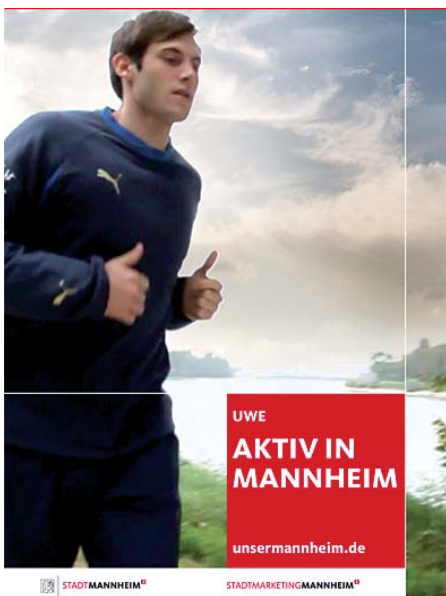
Auch Handball-Nationalspieler Uwe Gensheimer von den Rhein Neckar Löwen ist aktiv in Mannheim.