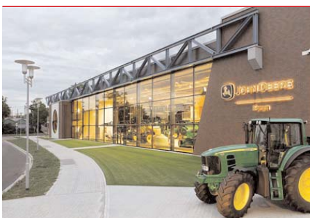
Im John Deere Forum findet am 17. November die 7. Arbeitsmarktkonferenz in der Metropolregion Rhein-Neckar statt.