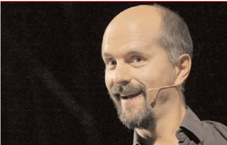
Christoph Maria Herbst