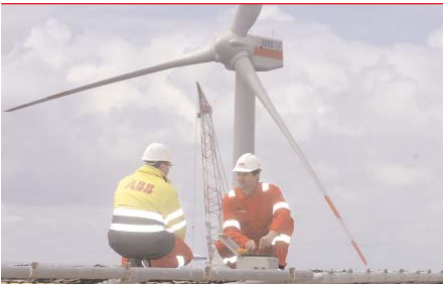
Dicker Fisch: ABB Deutschland betreut von Mannheim aus den Nordsee-Windpark von TenneT.