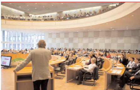
Starke Resonanz: Über 260 Teilnehmer waren zur 2. Mannheimer Bildungskonferenz angereist