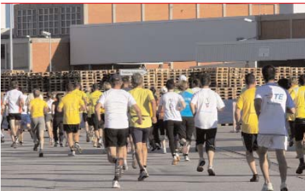
Rund 700 Teilnehmer erkundeten beim TeaMATHlon im Lauftempo das Werksgelände von SCA Hygiene Products.