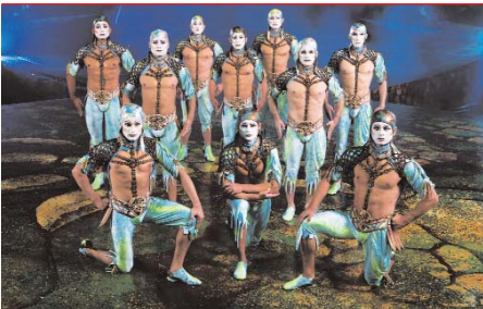
Cirque du Soleil