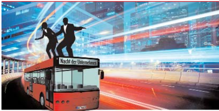
Erste Mannheimer Nacht der Unternehmen: Vorfahrt für Job-Perspektiven.

nach Fachkräften sind, können sich jetzt anmelden. Die Veranstaltung bietet ihnen die Gelegenheit, ihre Bewerber direkt im eigenen Haus kennen zu lernen. Im Gegenzug können sich potenzielle Mitarbeiter ein ganz persönliches Bild vom zukünftigen Arbeitgeber machen. Die „1. Nacht der Unternehmen“ beginnt um 16.30 Uhr mit einer Auftaktveranstaltung im John-Deere Forum. Danach führen unter dem Motto „Vollgas zum Job“ Bustouren auf mehreren Linien die Studierenden und Young Professionals direkt zu den teilnehmenden Unternehmen. Anmeldungen sind noch bis zum 4. November möglich. Kontakt: TEMA AG, Tel. 0241-889700 oder ndu-mannheim@tema.de.