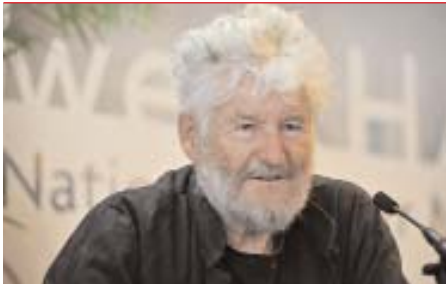
„Regisseur des Jahres“: Achim Freyer