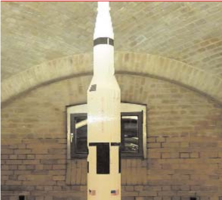
Wunderwerk der Technik – aus Lego.