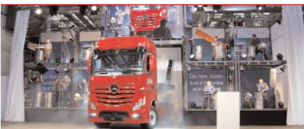
Feierlich ist die Actros-Produktion in Wörth aufgenommen worden. Der Motor des neuen Lkw kommt aus dem Mannheimer Benz-Werk.