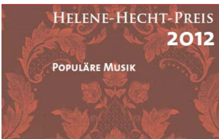
Jetzt bewerben: Die Anmeldefrist für den Helene-Hecht-Preis endet am 30. November.