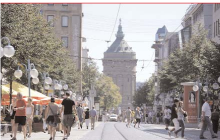
Mannheim im Aufwind: Die Übernachtungszahlen schnellen in die Höhe.