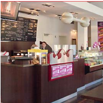
Ein Best-Practice-Beispiel in Sachen Nachhaltigkeit: das Hot-Dog-Restaurant O'Dogs.