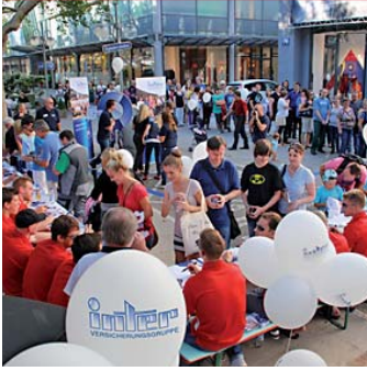
Die Adler waren bei der INTER Versicherungsgruppe zu Gast