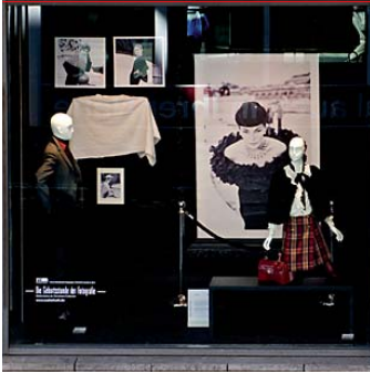
Schaufenster des Modehauses Engelhorn.