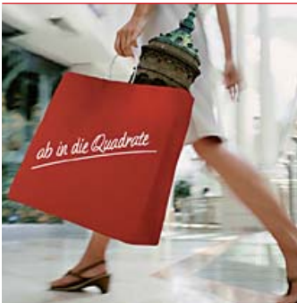
Ab in die Quadrate – zum verkaufsoffenen Sonntag am 7. Oktober.