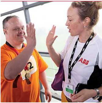
ABB-Mitarbeiter unterstützen Athleten mit geistiger Behinderung als freiwillige Helfer.