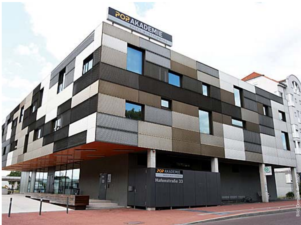
Alles Gute! Am 19. Juli wird das Zehnjährige der Popakademie mit einem Konzert im Capitol gefeiert.