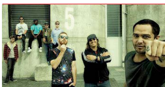
Batucada Sound Machine