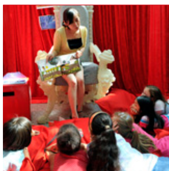
Im „Zelt der Geschichten“ dreht sich alles um internationale Märchen und Geburtstagsgeschichten.