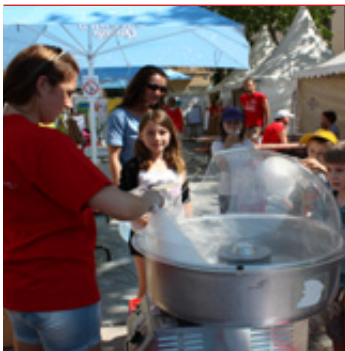
Zahlreiche Sponsoren sorgen dafür, dass das Fest auch bei seiner zehnten Auflage kostenlos bleibt.

Auch beim Kinderfest 2013 bringt SCA Hygiene Products den Zewa-Toilettenwagen sowie das Tork-Familienmobil zum Einsatz. Direkt auf dem Kinderfestgelände befinden sich die komfortablen Toiletten, die für einen entspannten Besuch des Fests sorgen. Und das gilt für Groß und Klein: Ein kindergerechtes WC mit Wickeltisch ermöglicht einen reibungslosen Ablauf beim Windel wechseln, und der großzügige Eingangsbereich gestattet auch Rollstuhlfahrern einen problemlosen Zugang. Außerdem gibt es bunte und lehrreiche Schautafeln rund ums Thema Hygiene und Händewaschen. Die qualitativ hochwertigen Toilettenwagen erzeugen Wohlgefühl – SCA Hygiene Products setzt damit einen Trend in der Hygienepapierbranche. Darüber hinaus stellt SCA Hygiene Products eine große Zahl an Auszubildenden für die Auf- und Abbauarbeiten sowie zur Betreuung der einzelnen Stationen zur Verfügung und engagiert sich somit beim Kinderfest nicht nur finanziell, sondern auch personell.