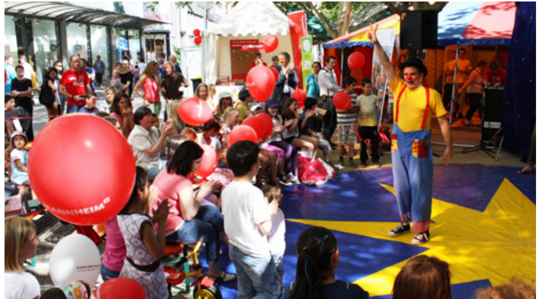
Seit 2004 sorgt das Kinderfest mit seinem kreativen Programm für Unterhaltung bei den jüngsten Stadtfestbesuchern.

Das Kinderfest feiert zehnten Geburtstag