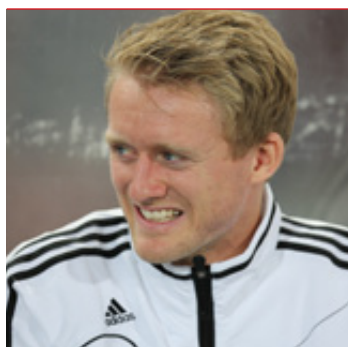
Fußballnationalspieler André Schürrle wird das Kinderfest am Freitag eröffnen.