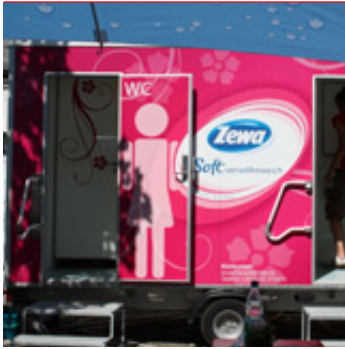
Der Zewa-Toilettenwagen steht dank des Hauptponsors SCA Hygiene Products auch in diesem Jahr für die Kinderfestbesucher bereit.