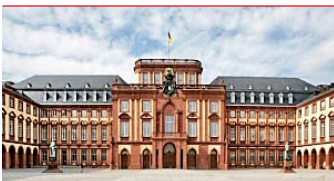
Das Institut für marktorientierte Unternehmensführung lädt zur jährlichen Frühjahrstagung ein.