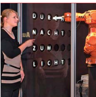
Im Technoseum bringt ein ABB-Roboter auf Knopfdruck den Titel der Ausstellung zum Leuchten.