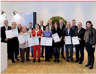
Auszeichnung für gelungenes Engagement: der FUCHS-Förderpreis.