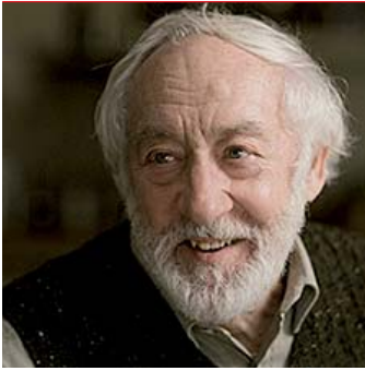
Dieter Hallervorden überzeugt in „Sein letztes Rennen“.