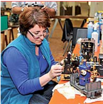
Technoseum: Bei Mannheim-Dampf im Technoseum gibt es viele tolle Modelle zu sehen.