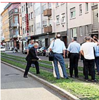
Das „Forum Stadtbahn-Nord“ bei einer Ortsbegehung der „B-Linie“: