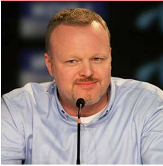
Stefan Raab lädt zum Sänger-Wettstreit in die SAP Arena.