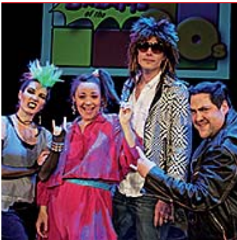
Das Capitol lässt die Sweet Dreams der 80er aufleben.