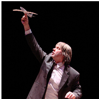
Third Angel und malavoadora gastieren bei Here&Now.

Englischsprachiges Theaterfestival im TiG7 feiert Jubiläum