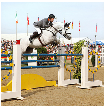
Auch am Start: Springreitlegende Ludger Beerbaum.