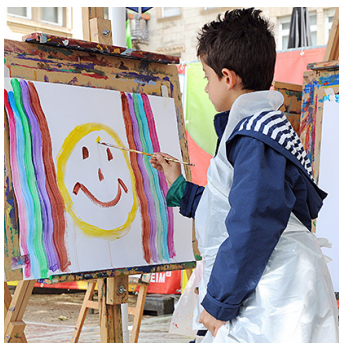
Auf dem Mannheimer Kinderfest können sich die Jungen und Mädchen auch künstlerisch austoben.