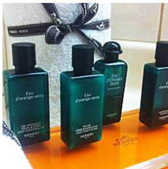
Neue Kooperation: BEST WESTERN PLUS Delta Park Hotel und Hermès.