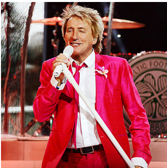
Lebende Legende: Rod Stewart gastiert im Sommer in der SAP Arena.