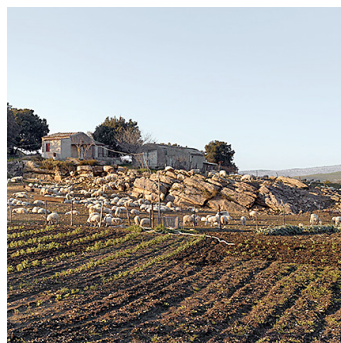
Die Idylle trägt. Foto-Ausstellung zeigt die verborgenen Spuren der Mafia.