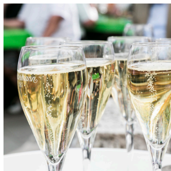
Der Rebensaft steht Mitte Mai in der Quadratestadt im Fokus.

Das Pflanzenschauhaus steht im Zeichen des Weltmeister-Trainers.