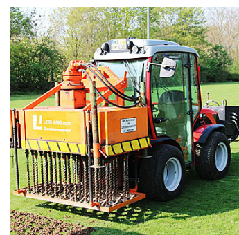
Die LIS Lieblang Industrie-Service GmbH kümmert sich nun auch um die Pflege von Sportplätzen.