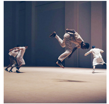
Der brasilianische Choreograf Bruno Beltrão präsentiert CRACKz.

www.das-gibt-dir-mannheim.de/pages/de/inspiration-es-formt.phtml | www.theaterderwelt.de