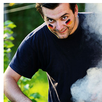
Foto auf Facebook hochladen und mit MVV Energie WM-Grillparty feiern.