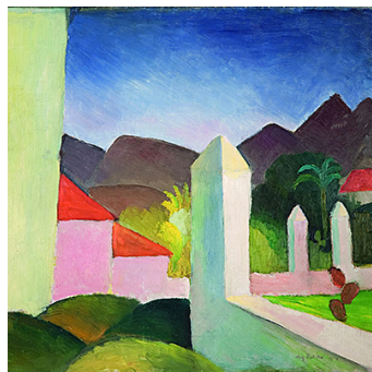
Auch die „Afrikanische Landschaft“ von August Macke wird ausgestellt.