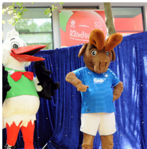
Mehr Maskottchen denn je warten dieses Jahr auf die kleinen Gäste des Kinderfests.