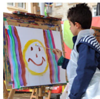
Mit Pinsel und Farbe nehmen kreative Ideen Gestalt an.

Nach Lust und Laune malen, gestalten und bauen mit den unterschiedlichsten Materialien – darum geht es im Kreativbereich! In den Ateliers der Freien Kunstakademie können Kinder Stabpuppen-Feen und Monstertaschen-Trolle kreieren, T-Shirts im Manga-Stil bemalen und Zauberwesen aus Fundstücken bauen. Am Stand der Stadtbibliothek sind architektonische Fähigkeiten beim Gestalten einer Traumbibliothek gefragt. Die passenden Bücher liegen bereits in der Fahrradbibliothek zum Lesen bereit. Am Stand des Kinderfest-Hauptsponsors SCA lernen die Kinder alles über das Papierschöpfen und können sogar ihr eigenes Papier herstellen. Was man mit Papier und Pinseln alles anstellen kann, zeigt dann die Kunsthalle. Wer gerne bastelt, wird dort ebenfalls fündig und kann Fantasiewesen aus Pfeifenputzern zum Leben erwecken. Bei den Reiss-Engelhorn-Museen (REM) dreht sich alles um das alte Ägypten: Passend zur Ausstellung „Ägypten – Land der Unsterblichkeit“, die im November 2014 startet, begeben sich kleine Gäste hier auf eine Reise zum Nil. Tolle Bastelmaterialien stellt wie im vergangenen Jahr der Rayhers Kids Club zur Verfügung, damit die Kinder ihrer Kreativität erneut freien Lauf lassen können.