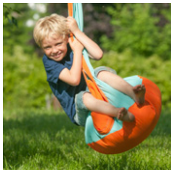
Zum Reinkuscheln, aber auch zum Schaukeln eignen sie sich – die Hängehöhlen von La Siesta.