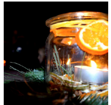
Bei „Advent im Park“ können sich Besucher des Luisenparks auf das Weihnachtsfest einstimmen.