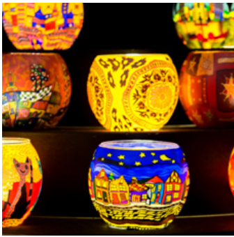
Insgesamt vier Mannheimer Weihnachtsmärkte verbreiten Adventsstimmung.