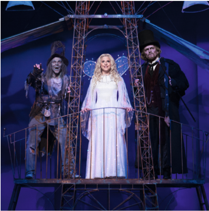
Das Familienmusical „Vom Geist der Weihnacht“ bietet Unterhaltung für Groß und Klein.