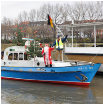
Auch der Nikolaus fährt mit auf dem Polizeiboot des Technoseum.