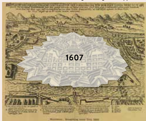
Stadtgründung mit Doppelstern

Schau dir das Stadtmodell an, das die Innenstadt im heutigen Zustand zeigt. Von dem Sprecher erfährst du die Geschichte der Stadt. Du siehst mithilfe der Lichtprojektion auf dem Modell, wie sich die Stadt im Laufe der Jahrhunderte verändert hat.